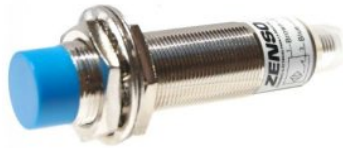
SENSOR INDUCTIVO 18X8MM 90-240VCA NC SALIENTE CONECTOR M12 82mm LARGO