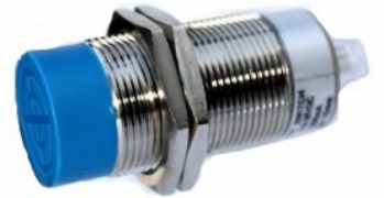
SENSOR INDUCTIVO 30X15MM 90-240VCA NO SALIENTE CONECTOR M12 75mm LARGO