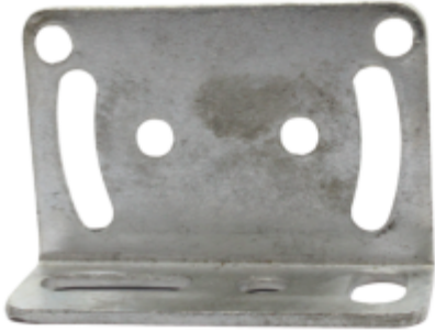
BASE PARA FOTOCELDAS